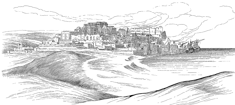
Tiɲu kuu bà ta booru Yafa

1 Wen yonde daare, Woro ta paana pooku ò òn tɔ nɔɔre Sonaasi, Amitai bika, ò wa : 2 « Yikisi, o taka tin kpɛɛɲu kuu bà ta booru Niniifu ku mii o nɛɛ pusi kperima o wa: yi basi kpantama meeki-di Woro ta paana pooku.» 3 Sonaasi sɛki òn yeeri sa ò taka Niniifu ò òn tiiki ò òn dɛɛbe Taarisisi cɔka , sa ò feekina Woro ta paana pooku. Maa ò ta nente tiɲu kuu bà ta booru Yafa, ò òn mɛɛ dà cɛɛ yima suka kaa ta takiri Taarisisi. Ò òn dɔɔrɛ ò suka taantu, ò òn diki bà i wò takirina Taarisisi weɲi, sa ò feekina Woro ta paana pooku.